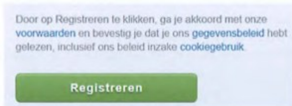
Afbeelding 44 (2014-2018)

In de tekst boven de knop 'Registreren' stonden hyperlinks naar de Gebruikersvoorwaarden, het Gegevensbeleid en het cookiebeleid.