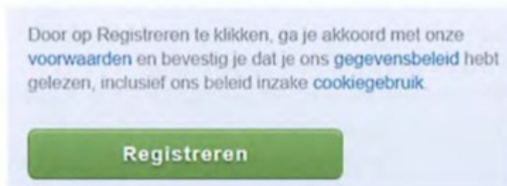
Afbeelding 44 (2014-2018)

12.46. Facebook Ierland heeft onweersproken toegelicht dat een nieuwe gebruiker die zich in deze periode bij de Facebookdienst wilde registreren, het volgende te zien kreeg: