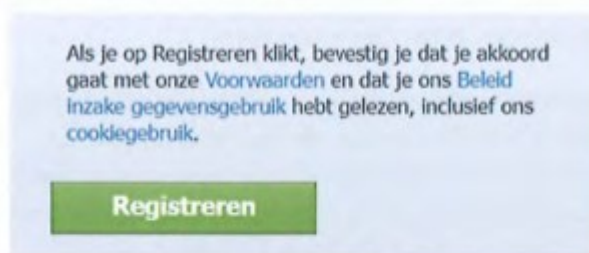
Afbeelding 43 (2012-2014)

12.41. Facebook Ierland heeft onweersproken toegelicht dat een nieuwe gebruiker die zich in deze periode bij de Facebookdienst wilde registreren, het volgende te zien kreeg: